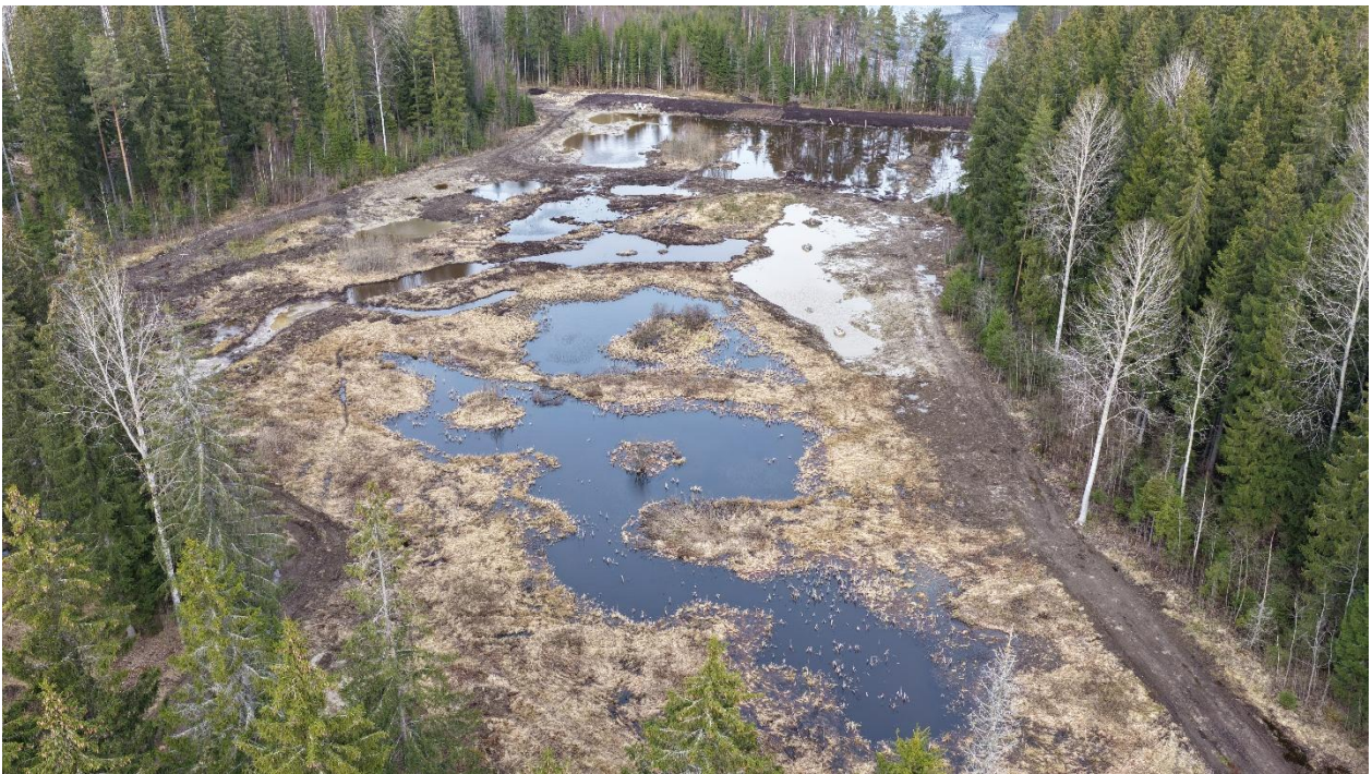
Kuvia Osaamista ennallistamiseen -hankeparin kohteilta talvi-kevät 2026