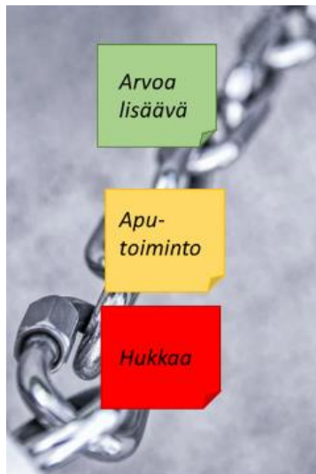
Kuva 2. Lean-ajattelun mukainen arvoketju tai prosessi, joka sisältää arvoa lisääviä toimenpiteitä, aputoimenpiteitä ja hukkaa.

Lean-ajattelussa arvoketju tai prosessi nähdään kuvan 2 mukaisesti erilaisten toimintojen tuloksena, joka sisältää arvoa lisääviä toimenpiteitä, välttämättömiä aputoimintoja ja myös hukkaan menevää työtä ja aikaa.